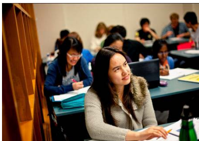
学习+工作 1 年