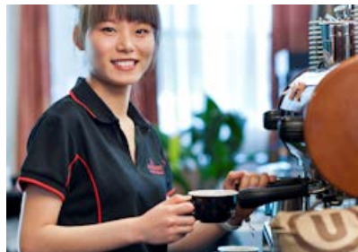
全职工作 1 年