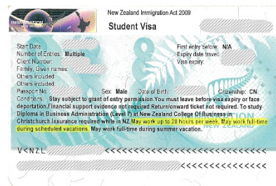
办理学生签证 (允许每周 20 小时工作)