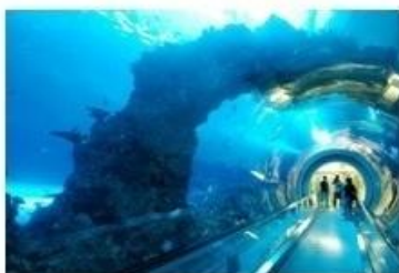
垦丁海洋生物博物馆